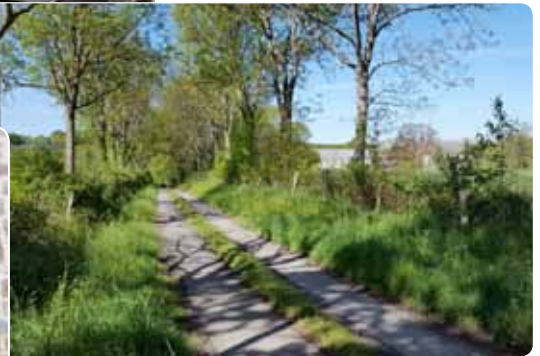
Le chemin d'accès à l'abbaye qui devra être aménagé pour accueillir les visiteurs.