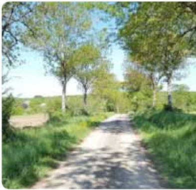
La voie communale étroite menant à l'abbaye.