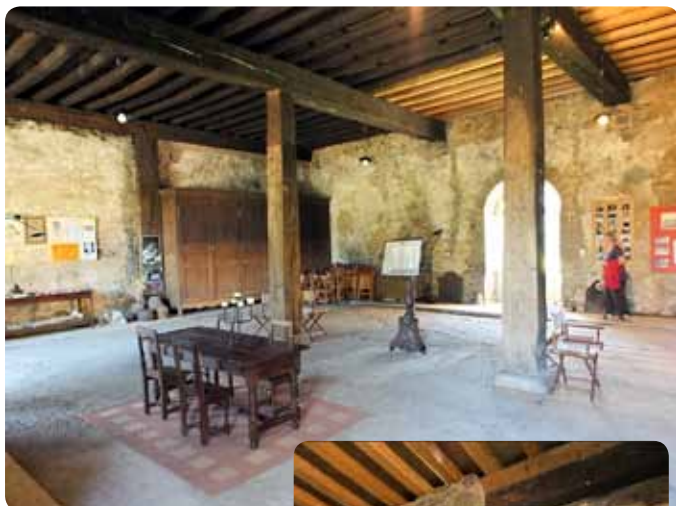
La salle capitulaire ou salle du chapitre. Les moines s'y réunissaient chaque jour pour entendre la lecture d'un chapitre de la Règle de Saint-Benoît.