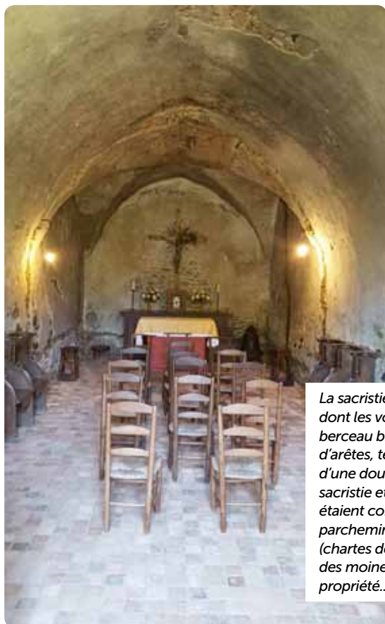
La sacristie du XII e siècle, dont les voûtes, moitié berceau brisé, moitié d'arêtes, témoignent d'une double fonction : sacristie et chartrier où étaient conservés les parchemins précieux (chartes de profession des moines, titres de propriété...)