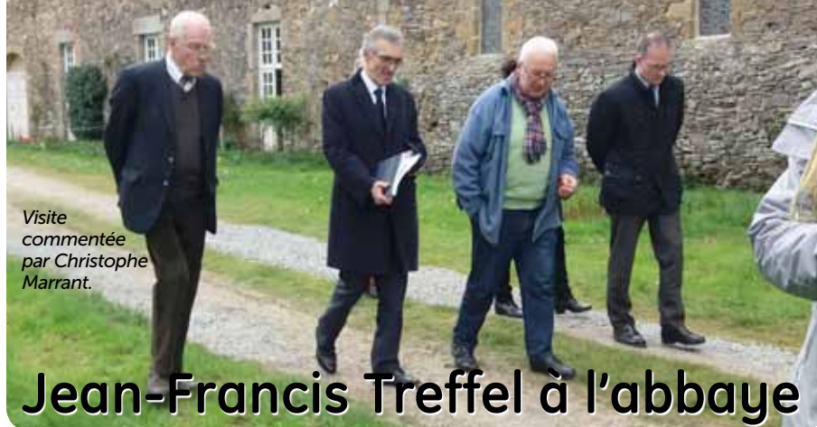
Visite commentée par Christophe Marrant.