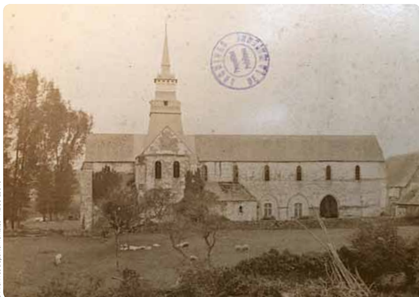
Cette carte postale datant de fin XIX e siècle, représente l'abbatiale vue du côté Nord. On constate que les bas-côtés ont été supprimés (avant la Révolution). L'imposant clocher du XVII e siècle est toujours en place.

L'église sert de hangar pour matériel agricole et de grenier à foin. On aperçoit encore la voûte lambrissée.